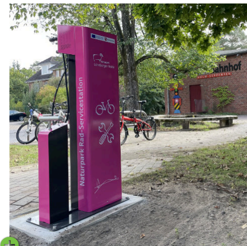
Naturpark Lüneburger Heide, Allemagne