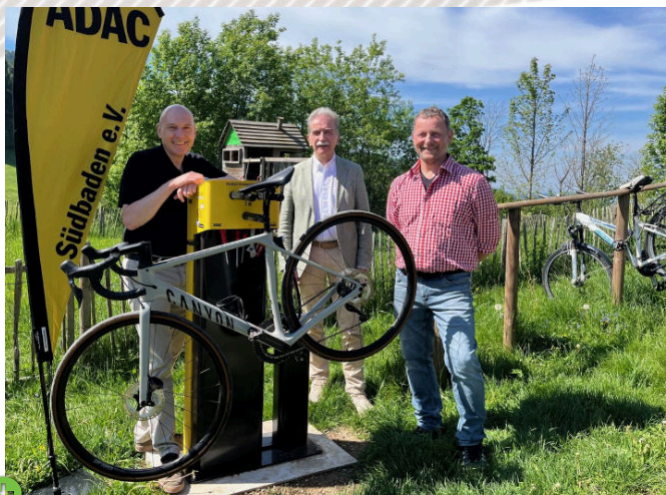
ADAC Südbaden, Holzschlägermatte, Allemagne