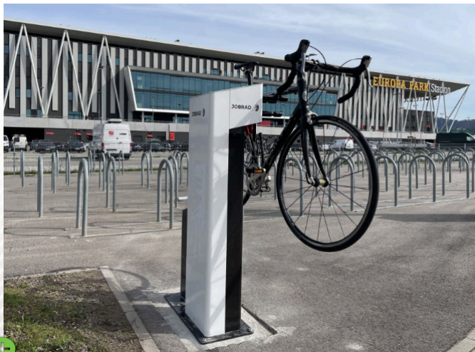
Europa Park Stadion, Fribourg, Allemagne