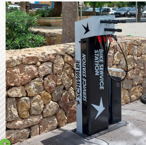
Sa Mola 13 Café, Sineu, Majorque