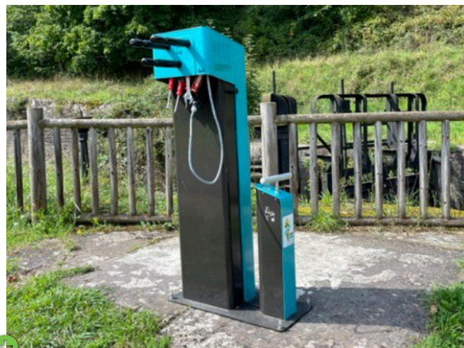
Vallée des Eclusiers, Arzwiller, Frankreich