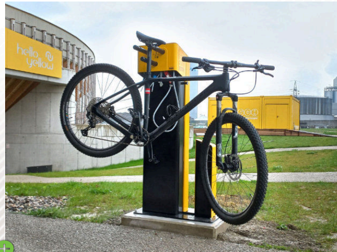
Velodrom Linz, Schachermayer, Österreich