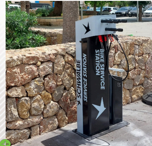
Sa Mola 13 Café, Sineu, Mallorca